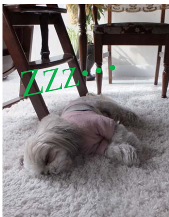
▲N様の愛犬ゴンちゃん。取材中、床暖房の上で気持ちよさそうに寝ていました。